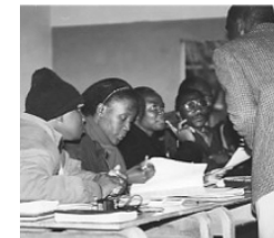
Miembros del Consejo de ZAFES

El equipo se reunió en mayo y en octubre para planificar. Queremos afianzar la visión y la continuidad de la obra estudiantil, y fomentar la unidad con los graduados de ZAFES. Nos centraremos en las principales actividades de formación - seminarios de liderazgo, talleres de estudio bíblico y conferencias regionales y nacionales. Los estudiantes se han mostrado muy entusiastas, pidiendo al equipo formación en evangelización, misión y en cómo llevar un grupo interdenominacional. El año pasado nos centramos en las