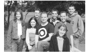
Asesores de IFES Irlanda

IFES Irlanda trabaja en la República de Irlanda y en Irlanda del Norte. Nuestra más profunda oración es que los estudiantes cristianos transmitan esperanza en las comunidades divididas y enfrentadas y que el evangelio trascienda las fronteras culturales y políticas.