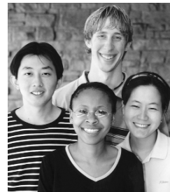
Estudio Bíblico de estudiantes internacionales, en Madison, Wisconsin

Desde Septiembre del 2001 han aumentado las oportunidades de hacer amistad y ayudar a estudiantes árabes en EE.UU. En algunas universidades, miembros de InterVarsity visitaron la Asociación de Estudiantes Musulmanes o defendieron a los estudiantes musulmanes cuando se les relacionaba injustamente con el ataque del 11 de Septiembre. En otras universidades, los estudiantes árabes se pusieron en contacto con InterVarsity: las buenas relaciones que hemos desarrollado durante años hicieron posible que confiaran en nosotros. Nos alegramos de que algunos estudiantes del Próximo Oriente estén descubriendo más acerca de la fe cristiana.