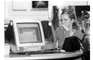
15000 personas por mes visitan el sitio web de STEP

Croacia está mirando al futuro. El gobierno está aplicando reformas económicas y políticas y el país es el segundo componente de la República Yugoslava después de Eslovenia que espera ser miembro de la Unión Europea.