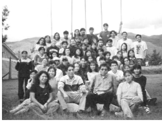
CCU campamento de capacitación

Hay muchas cosas de Bolivia que alegran nuestros corazones: su herencia cultural, su solidaridad, su música y lenguas aborígenes, la belleza de la selva tropical del Amazonas y sus cordilleras. Bolivia es un país rico y diverso. Pero la diferencia entre ricos y pobres es cada vez mayor. Debe ser difícil para el gobierno dirigir un país con unos contrastes culturales, geográficos y económicos tan grandes.