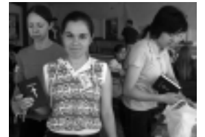
Estudiantes durante un campamento bíblico

En el principio de los 90, el equipo del “Proyecto Global” de IVCF/Estados Unidos hizo los primeros contactos con estudiantes cristianos en Moldova. Diez años después, 50 estudiantes participaron en el primer encuentro nacional, “Dios quiere trabajar donde estás”. En 2002, el movimiento nacional fue oficialmente registrado como Comunitatea Studentilor Crestini (CSC), la Comunidad de los Estudiantes Cristianos.