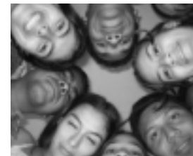
Estudiantes del Sur de Colombia