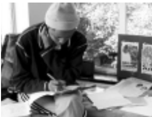
Responder al problema del SIDA

En junio pasado, representantes de seis movimientos estudiantiles participaron a una consulta sub-regional, cuyo objetivo era el de reforzar sus capacidades de respuesta al problema del SIDA. Los obreros compartieron ejemplos de sus mejores acciones y los mayores retos que ellos encuentran. Fue un tiempo de reflexión para mejorar los planes de acción que emprenderán al retornar a sus países.